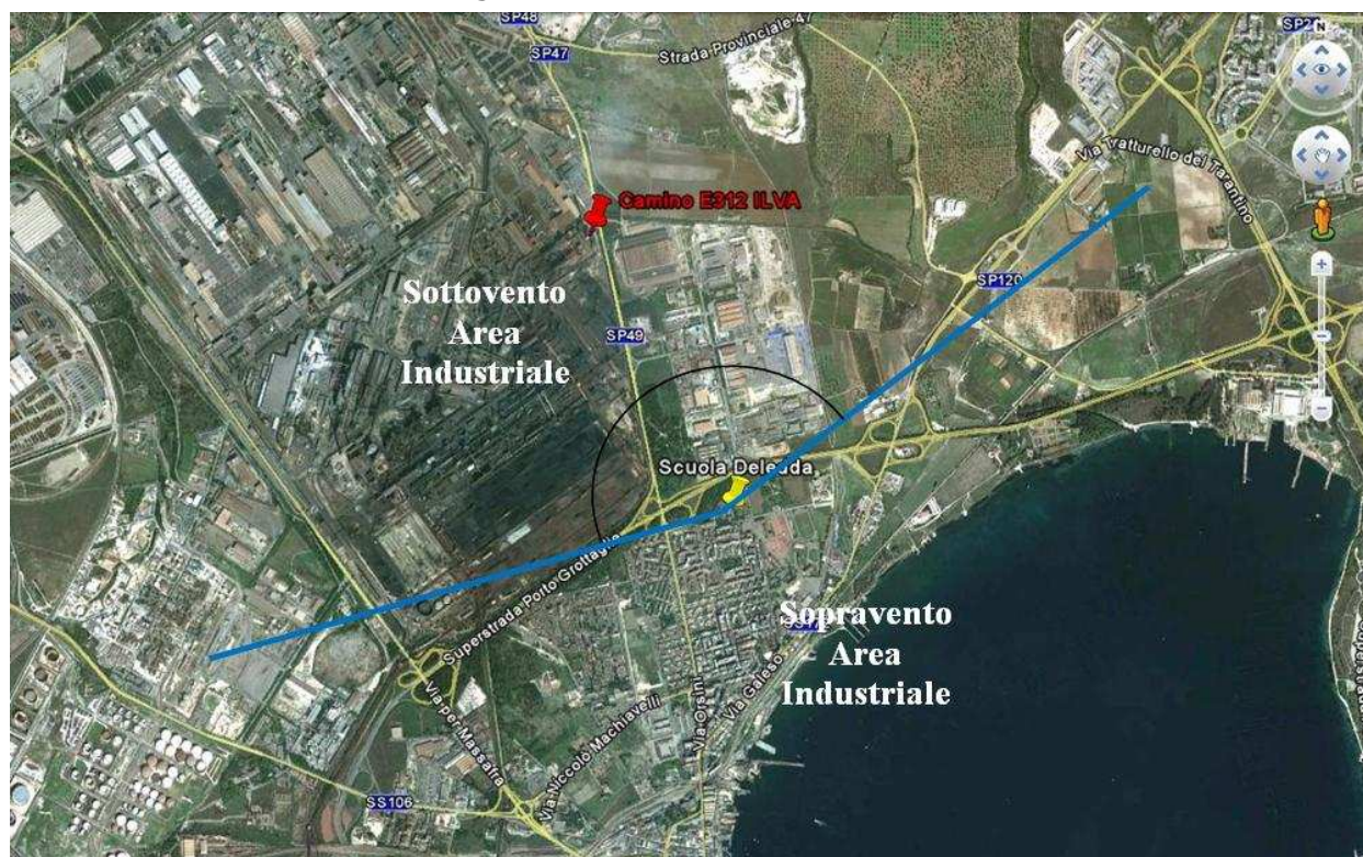
Figura 1 – Localizzazione campionatore WS (in giallo) e settori di campionamento sottovento e sopravento rispetto alla zona industriale