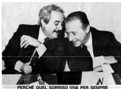
Falcone e Borsellino