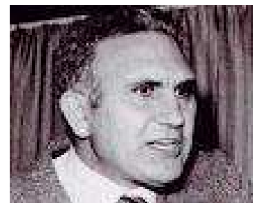
Pio La Torre